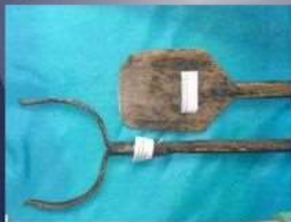
Лопата для печи, ухват